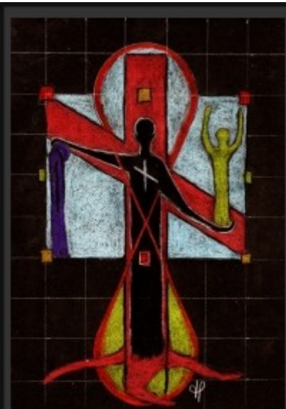
8-Rune Noth, Gerechtigkeit Schicksal, Not, Leid, Überwindung, Gerechtigkeit