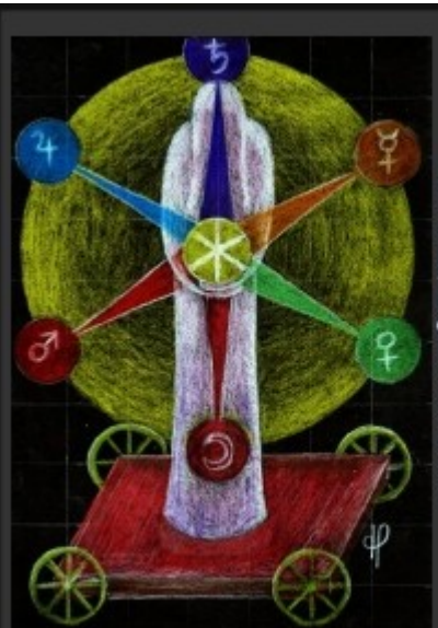
7-Rune Hagal & Wagen Schützend und heilend in Krisen, das Göttliche in der Welt, Beginn von Neuem