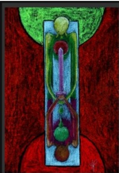
9-Rune Ilsa & Erenit Bewusstseinsarbeit, ICH, Sammlung, Konzentration, Verhärtung, Isolation.