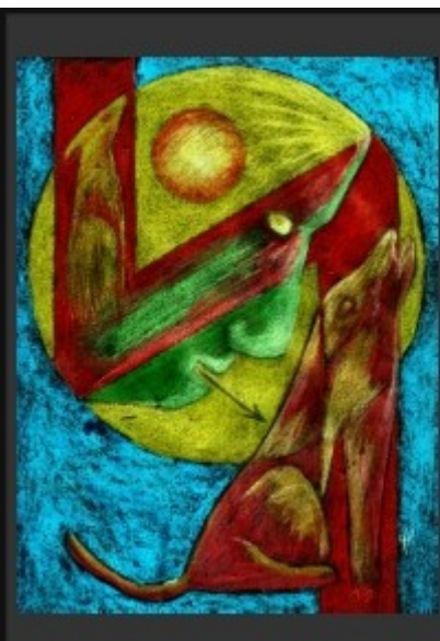
11-Rune Sig & Stärke Leben, innere Stärke, Durchhaltewermögen, Bändigung