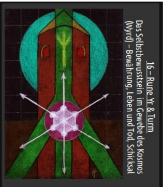
16 - Rune Yr & Turm Das Selbstbewusstsein im Gewebe des Kosmos (Wyrd) - Bewährung, Leben und Tod, Schicksal