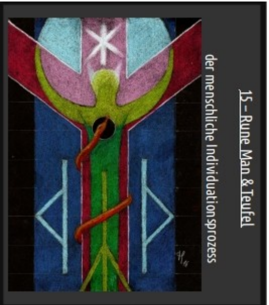
15 - Rune Man & Teufel der menschliche Individuationprozess