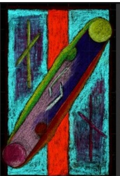
10-Rune Ar & Rad Naturkreisläufe, Lebenskreisläufe, Rhythmen, Freude, Ernte, Wohlstand