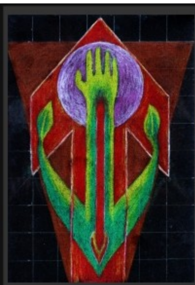
12-Rune Tyr & der Gehängte Opferung, Hingabe, Einschränkungen, Bindungen, Ordnung